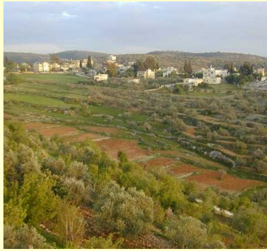
بيت ريماء مسقط رأس الشيخ الريماوي

ولد الشيخ علي الريماوي سنة ١٨٦٠م في بلدة بيت ريماء ، قضاء رام الله ، وتلقى دراسته الأولية على والده الشيخ محمود الريماوي ، أحد علماء عصره ، وفي مدارس القدس ، ولا سيما المدرسة الرصاصية . سافر بعد ذلك إلي مصر لاستكمال دراسته في الأزهر . وجاور هناك مدة اثني عشر عاما درس خلالها أصول الفقه واللغة العربية وآدابها . واشتهر في مصر بقرض الشعر ، وأخذ ينشر الكثير منه في صحف القاهرة ، وفي مجلة المنهل المقدسية التي أنشأها موسى المغربي . وعاد إلي القدس وسكن فيها ، وعين مدرسا للفقه وعلوم اللغة العربية في إحدى مدارسها لأن الشعر