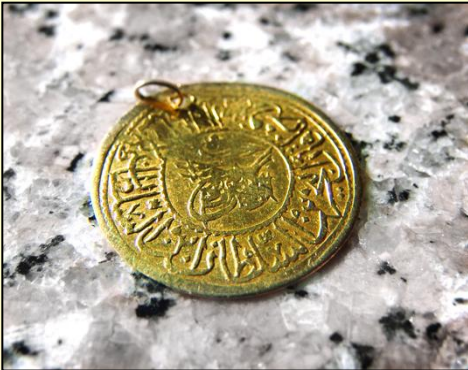
عملة فلسطينية قديمة

تقبل في التجارة العالمية في حوض البحر المتوسط، وعلاوة على ذلك فإن العملات الصليبية في سورية وفلسطين صارت هي العملة المعمول بها في معاملات سكان البلاد، وفي الوقت نفسه كان الصليبيون يسكون عملاتهم الخاصة من الفضة والنحاس على نمط العملة الفرنسية المعاصرة لها فإلى جانب اسم الملك الحاكم الذي كان يكتب على الإطار، والصليب المنقوش في الوسط، كانت مثل هذه العملات تحمل على الوجه الآخر صورة برج داود أو صورة الملك الحاكم، وكانت اغرب العملات الصليبية طرافة هي تلك التي سكت بعد القرن السابع الهجري/ منتصف القرن الثالث عشر الميلادي، وعليها كتابة عربية تمجد الثالوث المقدس، لقد كان ذلك حلا عمليا يسمح لدار سك النقود المسيحية أن تعلن عن عقيدتها دون حثث أو عبث بالمقدسات، بان نستفيد في الوقت ذاته من السوق العالمي.