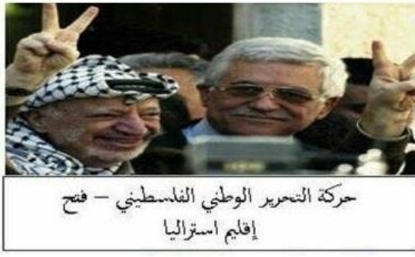
حركة التحرير الوطني الفلسطيني - فتح إقليم استراليا