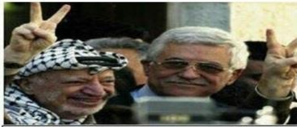
حركة التحرير الوطني الفلسطيني - فتح إقليم استراليا